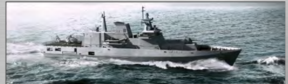
MMPV90 Corbetas En construcción