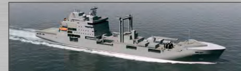
MBV 707 Buques de aprovisionamiento logístico En construcción