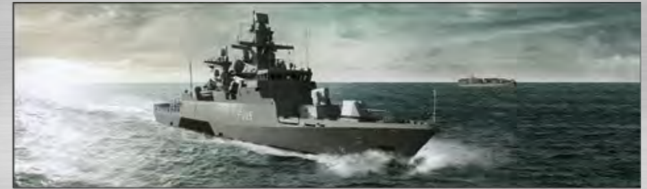
K130 (embarcaciones 6 a 10) Clase Köln Corbetas En construcción

Sea cual sea el requisito o el presupuesto, somos flexibles y ofrecemos soluciones navales a medida a partir de un único origen. La amplitud de nuestra experiencia queda demostrada a través de nuestra cartera, que abarca desde embarcaciones rápidas de patrulla y buques de patrulla en altamar hasta corbetas, fragatas, embarcaciones dragaminas y barcos de apoyo logístico.