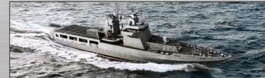
SEA 1180 Clase Arafura Embarcaciones de patrulla en altamar En construcción