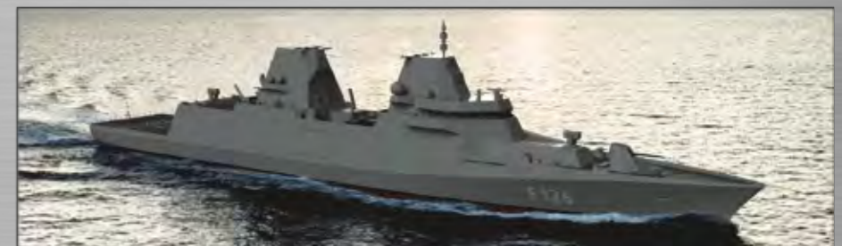
F126 Fragatas (como subcontratista) En construcción